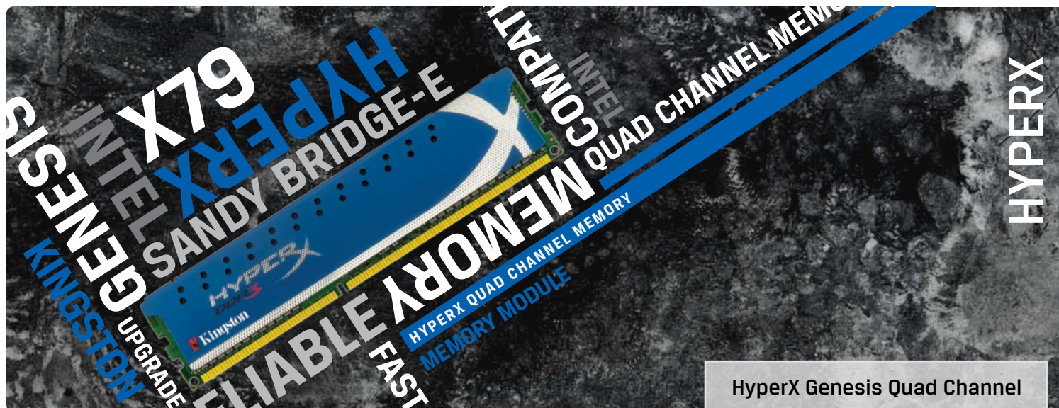
HyperX Genesis Quad Channel