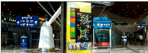
Cartelería y señalización digital