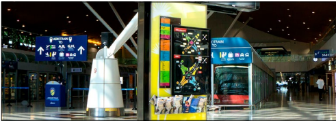
Papan Nama Digital