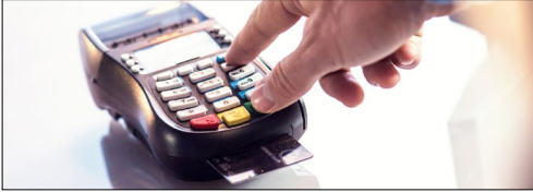
Punto de venta (POS)