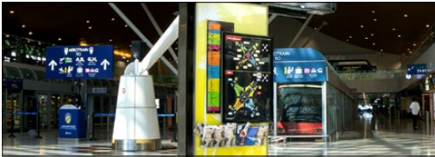
Bảng chỉ dẫn Kỹ thuật số