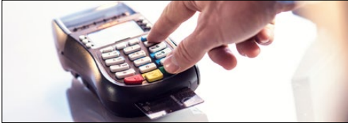
Điểm bán hàng (POS)