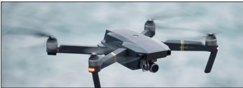
Drones de entrega