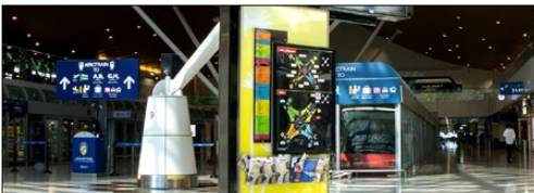
Papan Nama Digital