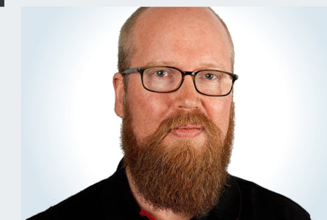
Pasi Siukonen @Pasi_Kingston

« Pour moi, tout dépendra de la volonté ou de la capacité de collaboration et de co-crédation - surtout du point de vue des villes intelligentes ».