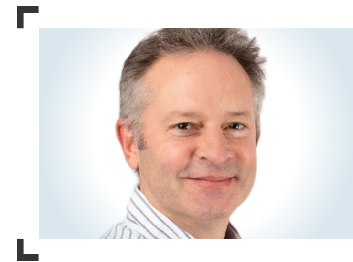
Rob Allen @Rob_A_kingston

Avec l'augmentation de la puissance de calcul en périphérie, il sera possible de créer des concepts technologiques que nous ne pouvons pas encore imaginer. En bref : les possibilités ne sont limitées que par la capacité de l'imagination humaine.