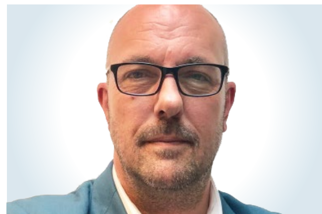
Neil Cattermull @NeilCattermull

La construction des grands datacenter a suscité de nombreuses innovations, incluant par exemple des constructions sous l'eau pour réduire les besoins en climatisation. Pourtant, les datacenter plus petits ne pourront pas autant bénéficier de solutions facilitées par le monde naturel. Les consommateurs s'attendent à une réflexion réellement innovante à une époque où l'impact écologique figure parmi les plus hautes priorités sociétales.