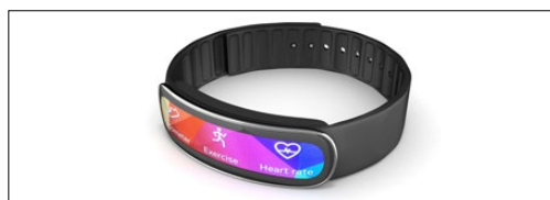
穿戴式设备 (智能腕表、健康监视器、增强现实和虚拟现实)