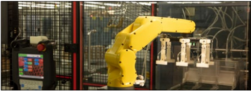
IoT industri / automasi pabrik &amp; robotik