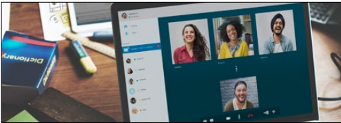
Modul jaringan 5G/komunikasi telekomunikasi (ruter WiFi dan perangkat mesh)