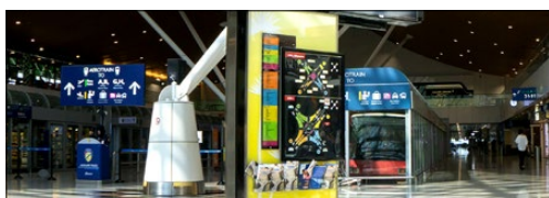
デジタルサイネージ