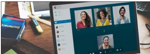
5G-Netzwerke / Telekommunikationsmodule (WLAN-Router und Mesh-Geräte)