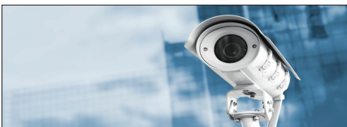
Giám sát/ghi âm thiết bị di động