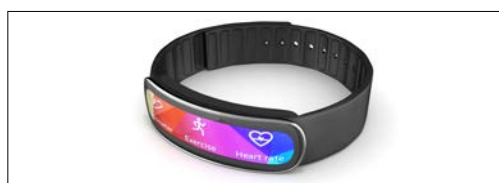
Indossabili (smart watch, dispositivi di monitoraggio della salute, AR e VR)