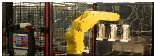
IoT industriale/robotica e automazione industriale