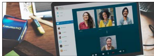
Moduły komunikacji sieciowej/telekomunikacji 5G (routery Wi-Fi i urządzenia typu mesh)