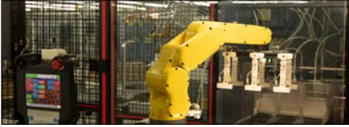
Endüstriyel IoT / robotik ve fabrika otomasyonu