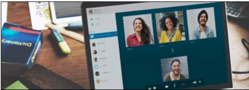
5G ağlar/telekomünikasyon iletişim modülleri (WiFi yönlendiriciler ve mesh cihazlar)