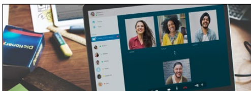
Modul jaringan 5G/komunikasi telekomunikasi (ruter WiFi dan perangkat mesh)