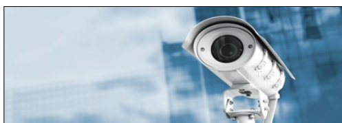
Hochauflösende Video-, Konferenz- und Überwachungssysteme