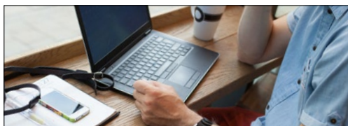
Smartphones, Tablets, PCs und Chromebooks