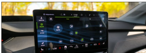
Вбудовані інформаційно-розважальні системи