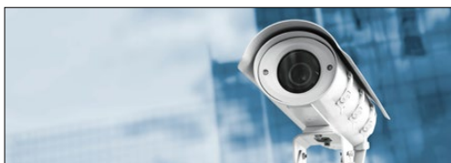
Відео високої роздільної здатності, системи конференц-в'язку та відеоспостереження