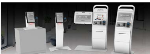
Equipamento de diagnóstico médico