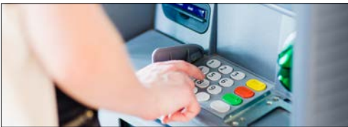
Quiosques (Estações de carregamento, Chaveiros, (ATMS))