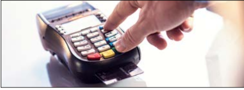
Ponto de vendas (POS)