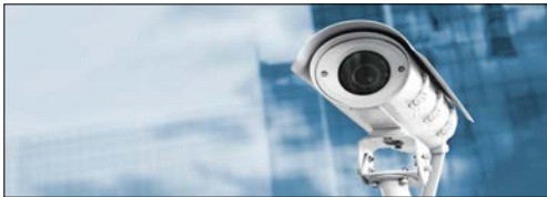
ระบบบันทึกกล้องตรวจการณ์/ระบบเคลื่อนที่