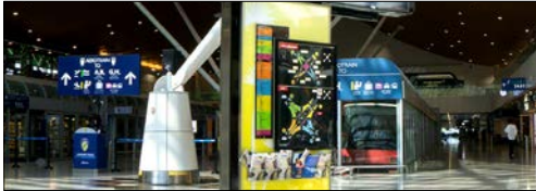
ป้ายดิจิทัล