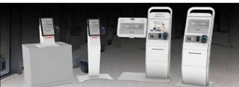
Tıbbi Tanı Ekipmanları