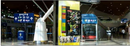
Bảng chỉ dẫn Kỹ thuật số