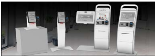
Thiết bị chẩn đoán y tế