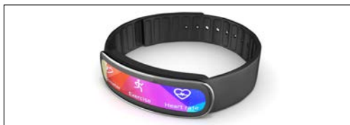
Urządzenia nasobne (inteligentne zegarki, monitory zdrowia, AR i VR)