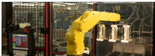
Przemysłowe zastosowania IoT / robotyka i automatyka produkcyjna