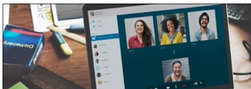
Moduły komunikacji sieciowej/telekomunikacji 5G (routery Wi-Fi i urządzenia typu mesh)