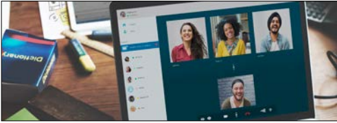
5G ağlar/telekomünikasyon iletişim modülleri (WiFi Yönlendiriciler ve mesh cihazlar)