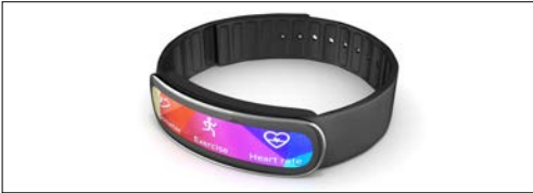
Giyilebilir cihazlar (akıllı saatler, sağlık monitörleri, AR ve VR)