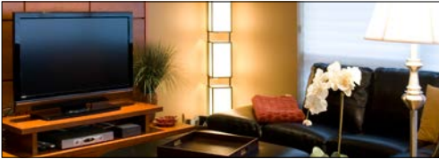
Akıllı ev (sound bar'lar, termostatlar, spor ekipmanları, Elektrikli süpürgeler, yataklar, musluklar)